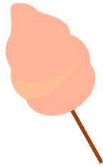
2 barbes à papa