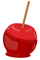
4 pommes d'amour