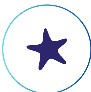
Une étoile de mer